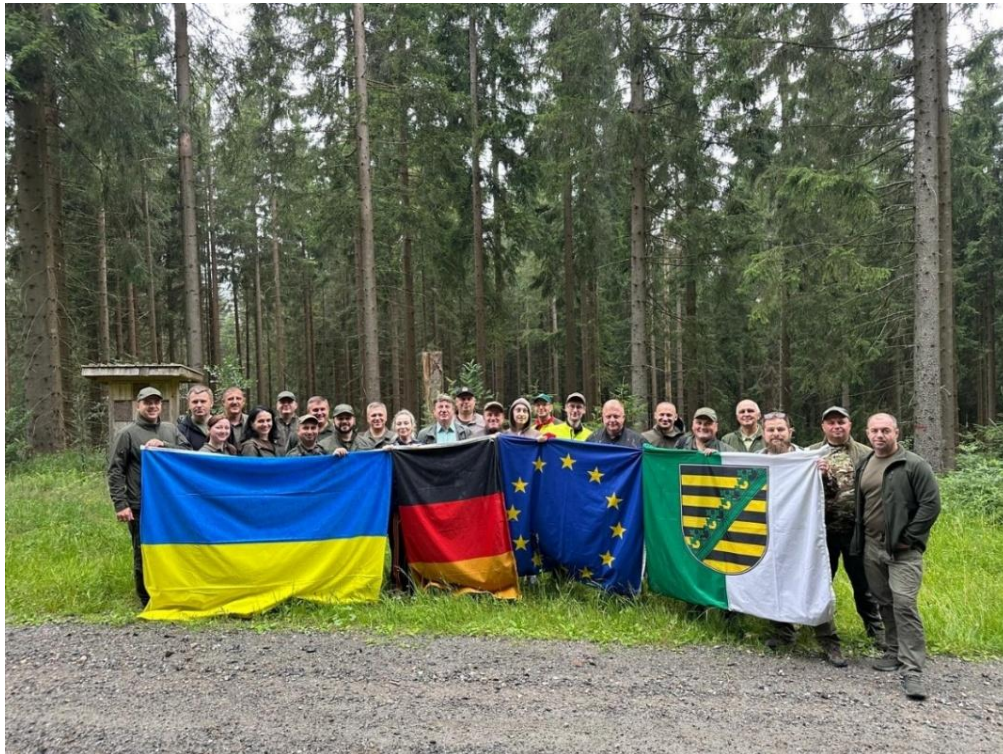
Gemeinsame Exkursion in Eibenstock im September 2025

Auf Vermittlung des Bundesvorsitzenden hat die Landesgruppe Sachsen (Eibenstock) zweimal jeweils 20 ukrainische Forstleute über fünf Tage in naturgemäßer Waldwirtschaft in Mittelgebirgen "fit" gemacht. Zwei weitere Schulungen in 2026 wurden gerade bewilligt. Die Begeisterung war so groß, dass Folgeveranstaltungen auch für kontinentaler geprägte Regionen in Brandenburg vorgesehen sind. Die Schulungen wurden großzügig vom BMLEH finanziell unterstützt.